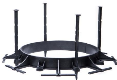
Kruh z obrubníku