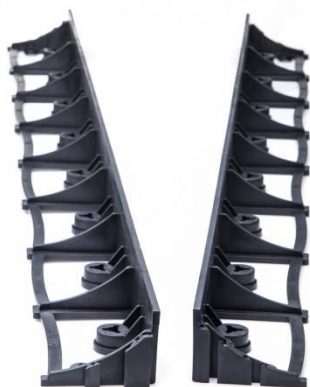
Pohled na obrubník BORDall