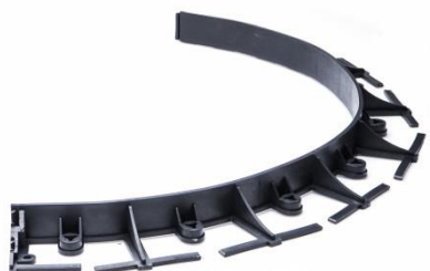
Oblouk z obrubníku