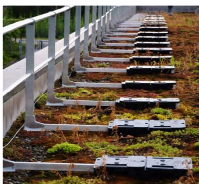
SAFEall GUARD STRAIGHT trvalé instalace