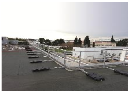
SAFEall GUARD STRAIGHT kolmé mobilní hliníkové zábradlí